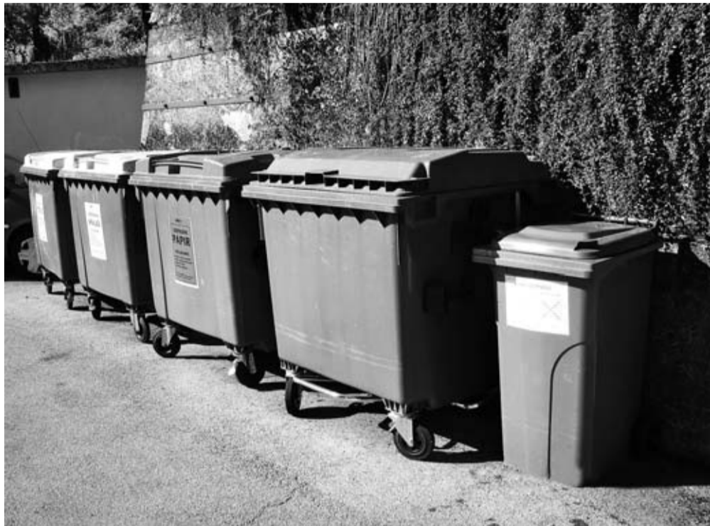
Biološke odpadke je dovoljeno odlagati le v ustrezne zabojnike ali kompostirati.

Konec junija je Ministrstvo za okolje in prostor pripravilo obsežno akcijo, s katero je opozorilo na obvezno ločeno zbiranje kuhinjskih odpadkov v gospodinjstvih. S številnimi medijskimi prispevki so ljudi opozorili na Uredbo o ravnanju z biološko razgradljivimi kuhinjskimi odpadki in zelenim vrtnim odpadkom, ki je bila sprejeta že maja 2010.