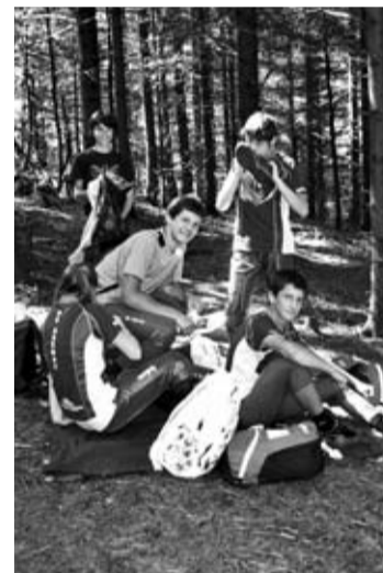
Trening z britansko reprezentanco.