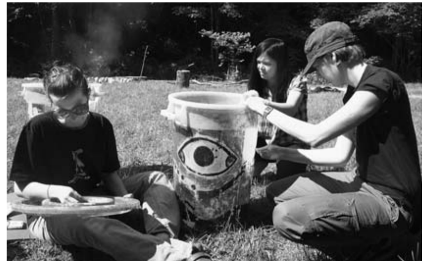
Za mednarodne prostovoljce je bilo bivanje v naših krajih svojevrsna kulturna dogodivščina.

Mladinski center C.M.A.K. se je v letošnjem letu priključil vseslovenskemu prostovoljskemu projektu Simbioz@, ki je namenjen predvsem medgeneracijskemu sodelovanju. Namen projekta je preko sodelovanja med dvema generacijama dvigniti računalniško pismenost starejših. Delavnice, na katerih se bodo starejši lahko učili računalniških veščin, bodo potekale od 17. do 21. oktobra 2011, in sicer na različnih lokacijah po celi Sloveniji, v Cerknem pa v prostorih mladinskega centra C.M.A.K., kjer je na voljo zadostno število računalnikov in druge računalniške opreme. Mladi prostovoljci bodo zainteresirane starejše občane učili in jim pomagali pri spoznavanju