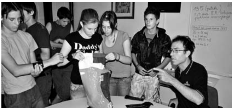
Zadnji posveti s trenerjem Leonom Piskom pred odhodom na svetovno tekmovanje