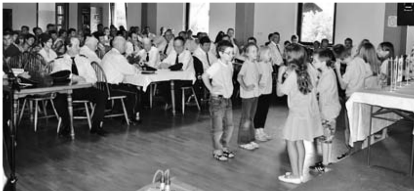
Učenci OŠ Cerknno, PŠ Novaki so z domiselnim programom pozdravili svečani zbor ZŠAM.

Centralno šolo bo v letu 2011/12 obiskovalo okroglo 300 učencev, kar je za deset manj kot v preteklem šolskem letu. Ob dejstvu, da v priho-