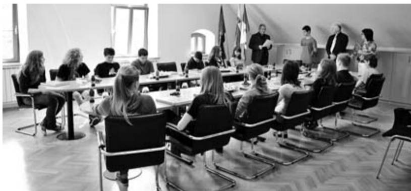
Predstavniki devetošolcev na svečanem srečanju z županom.

dnjih letih razlike med vpisanimi prvošolci in generacijami, ki zapuščajo šolo, ne bodo več tako velike, se bo predvidoma to število v prihodnjih letih ustalilo, saj demografski kazalci ne beležijo bistvenega upada rojstev do leta 2009.