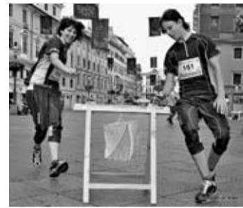
Pokal Alpe Adria.