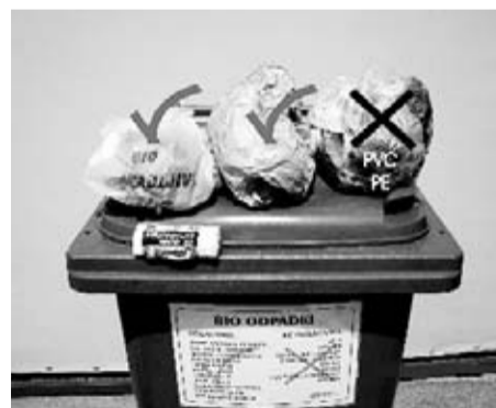
Biološki odpadki ne sodijo v plastične vrečke.

Hišni kompostnik mora imeti neposreden stik s tlemi. Osnovna plast zdrobljenih vej poskrbi za dobro zračenje od spodaj in preprečuje zastajanje vode. Za optimalen razkrojni proces je pomembna zadostna ponudba kisika, ki jo dosežemo tako, da se suhi strukturni material