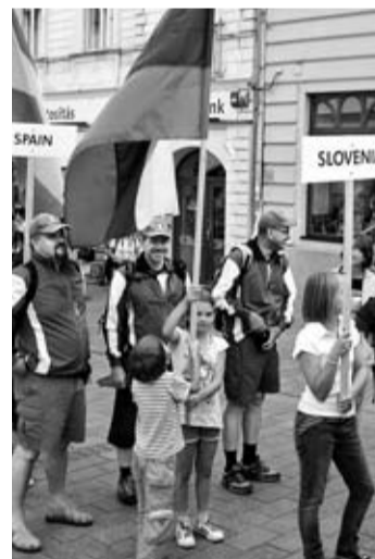
Svetovno veteransko prvenstvo.