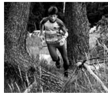
Evropsko mladinsko prvenstvo.