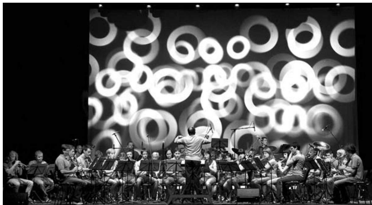
Cerkljanski godbeniki so na Prešernovem trgu v Ljubljani navdušili številno občinstvo.